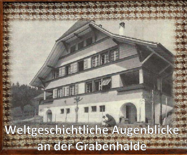
Weltgeschichtliche Augenblicke an der Grabenhalde